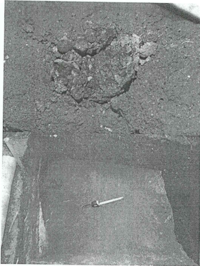
Imagen 3. Mostrando el fragmento de mazorca carbonizada en lote 5, op. NN-10b (Espigares)