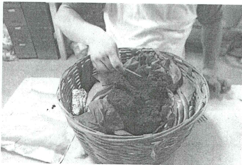
Imagen 4. Retirando los fragmentos de la mazorca carbonizada para su conservación (Espigares 2015)